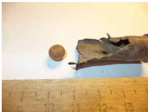
Рисунок 4 – Янтарная бусина

Кроме православной религиозной протективной ритуалистики в качестве оберега могли использоваться и предметы «бытовой» мистики. Примером такого оберега, возможно, является янтарная бусина из гильзы, найденной в окрестностях с. Кукушкино Лебяжьевского района Курганской области (рисунок 4).