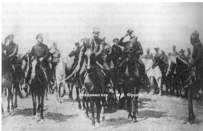
Рисунок 4 – Мадамин-бек и М.В. Фрунзе