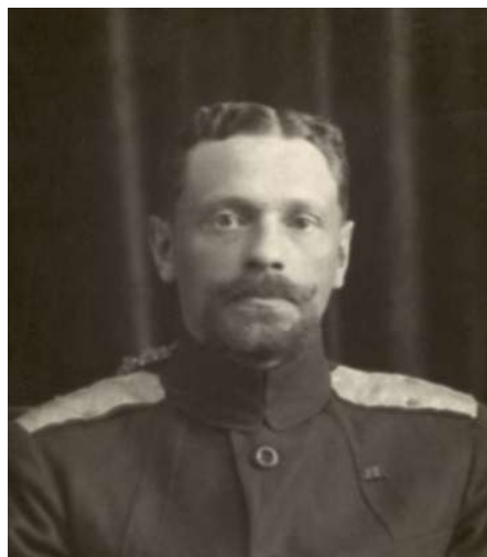
Рисунок 1 – Владимир Оскарович Каппель (1883–1920). 1919 г. РГВА

Правая колонна 5-й армии значительно отставала в своём продвижении от левой, действовавшей против отрядов Народной армии, отступавших от Чистополя и Елабуги. «Бездействие означенной группы вредно