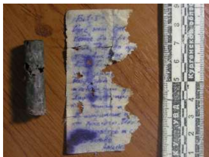
Рисунок 1 – Фрагмент листа бумаги с текстом молитвы Господней

значимость найденному артефакту с текстом молитвы придает то, что на обратной стороне листа указаны имя, фамилия и звание военнослужащего – владельца данного оберега: Прохоров Ефим Митрофанович 1882-Х-17 Унтер-офицер ?8 Симбирского стрелкового батал(ьона – С.Д.) (рисунок 2).