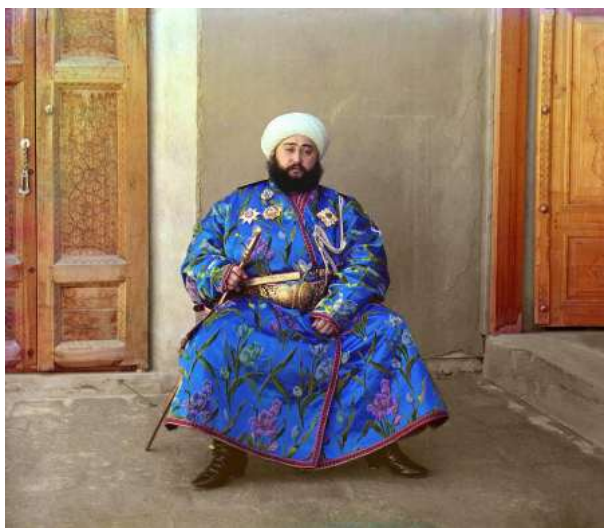
Рисунок 3 – Мадамин-бек

Среди знакомых Мадаминбека был вернувшийся с западного фронта «русский тюря», то есть генерального штаба генерал-майор Муханов, активный сподвижник генерала С.Г. Корнилова. Мадамин-Бек установил с ним тесное общение и по его совету приступил к переформированию отряда на основах правильной военной организации. В ка-