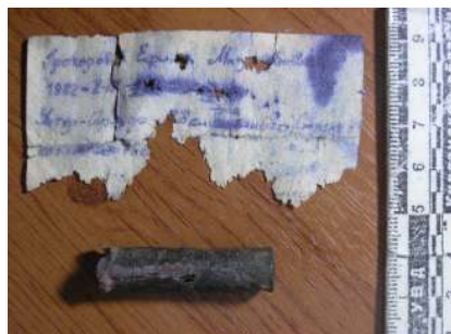
Рисунок 2 – Обратная сторона фрагмента листа бумаги с текстом молитвы Господней

Как указывают исследователи, именно 9-й Симбирский полк, в состав которого, по-видимому, входил указанный стрелковый батальон, находился на позициях возле с. Бараба, противостоя войскам РККА [5, с. 111]. Таким образом, представленный артефакт является персонализированным оберегом, выполняющим не только протективные функции, но и, по всей вероятности, функции солдатского медальона, обозначая тем самым оригинальную двойственность ситуации – сочетание охранительной функции с подразумеваемой функцией солдатского медальона в качестве способа идентификации погибшего бойца. Одна из возможных интерпретации такой двойственности заключается в том, что военнослужащий, не исключая возможности своей гибели и, будучи психологически готовым к ней, хотел бы погребения по христианскому обряду, о чем и просит в своем молитвенном обращении.