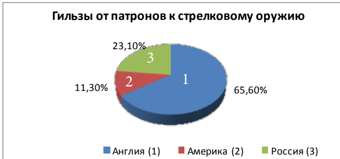
Диаграмма 1 – Процентное соотношение гильз от патронов 7,62x54 с учетом стран-производителей боеприпасов

На рисунке 1 представлено процентное соотношение гильз 7,62x54 от патронов к стрелковому оружию с привязкой к странам-производителям.