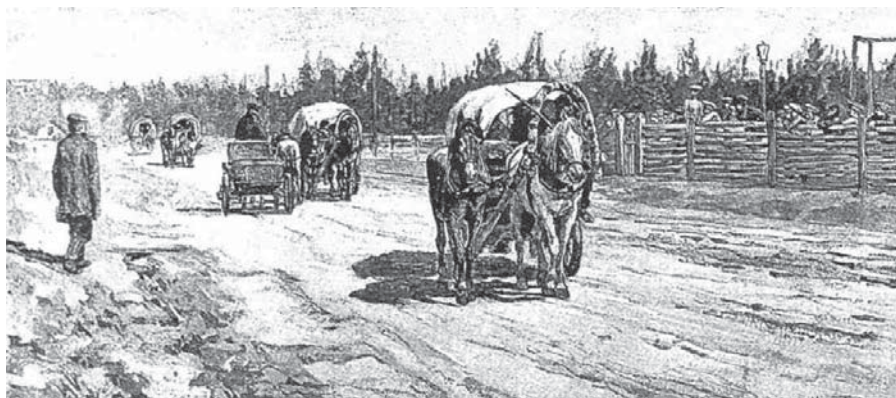
Рисунок 7 – Переселенцы в пути