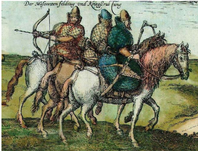
Рисунок 1 – Дети боярские XVI в. Раскрашенная гравюра Сигизмунда фон Герберштейна «Записки о Московии»). [URL: ( https://ru.wikipedia.org/ )].