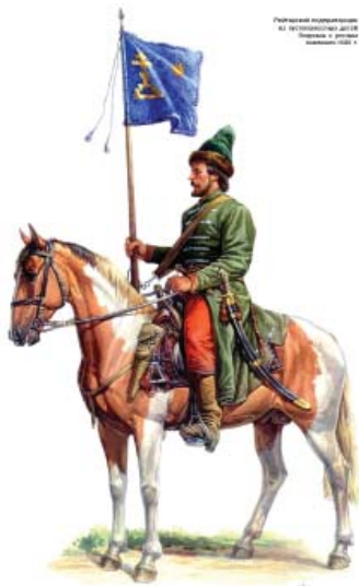
Рисунок 4 – О.В. Федоров. Рейтарский подпрапорщик из пустоместных детей боярских, 1690 г. [URL: https://ru.wikipedia.org/ ]