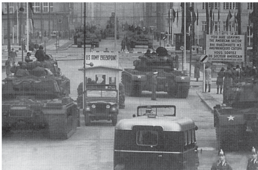
Фото 4 – Советские и американские танки у «черк-пойнт Чарли» на Фридрихштрассе. Берлин, 1966 г.