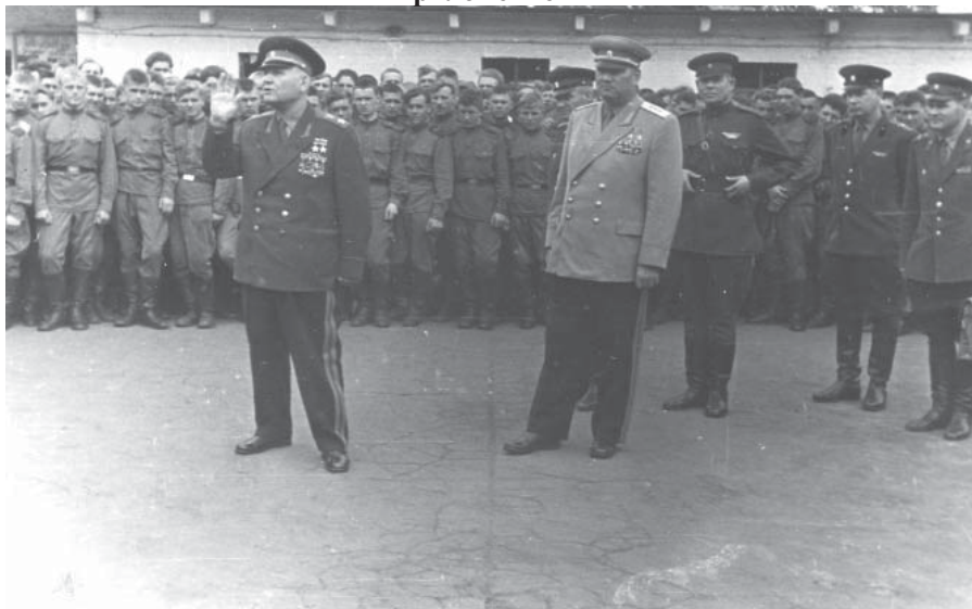
Фото 1 – Накануне сооружения Берлинской стены. На переднем плане – командующий группой советских войск в Германии маршал И.С. Конев, генерал армии И.И. Якубовский. Берлин, 1960-е гг.