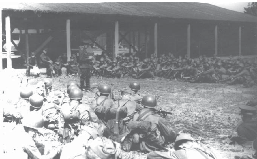
Фото 2 – Группа советских войск в Германии, сбор по боевой тревоге. Берлин, 1960-е гг.