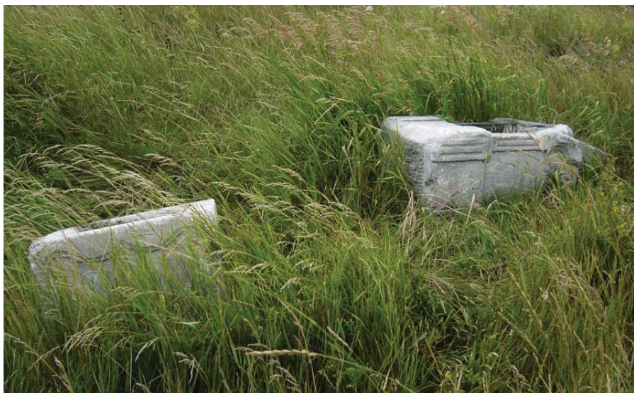
Фото 2 – Фрагменты разрушенного памятника, 2013 год