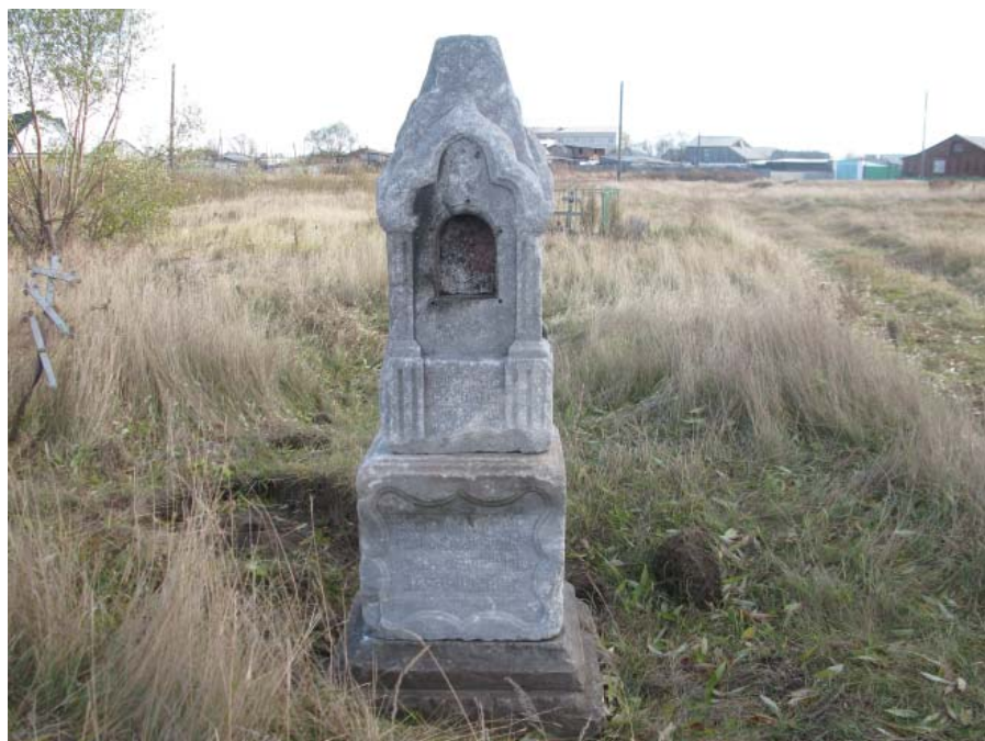
Фото 5 – Вид памятника после восстановления на прежнем месте, 2013 год