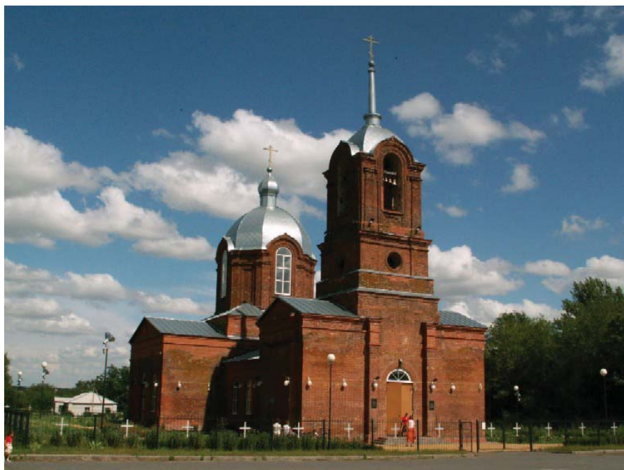
Рисунок 6 – Храм в честь Михаила Архангела в селе Архангельском Старооскольского района Белгородской области в наши дни [URL: https://fotki.yandex.ru. ].