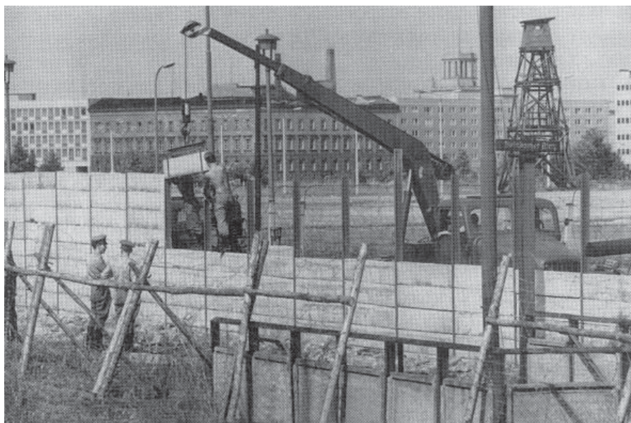
Фото 3 – Возведение «3-й очереди» Берлинской стены из бетонных плит. Потсдамская площадь, 1966 г.