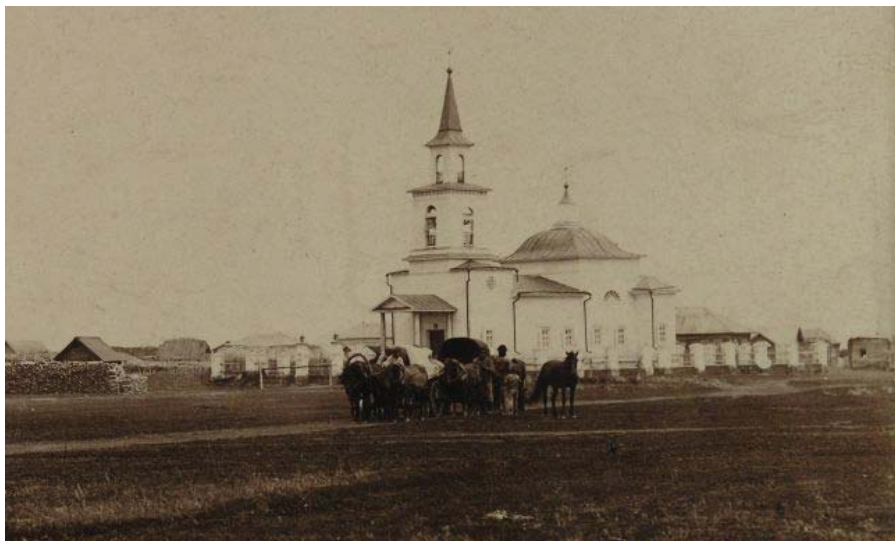
Фото 1 – Свято-Троицкая церковь в селе Половинском, 1895 год