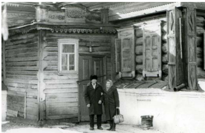
Фото 10 – Встреча двух беглецов из ссылки, брата и сестры Родиона и Устиньи Мякининых через 42 года разлуки у дверей родного дома, в который их не пускают. Село Каширино, 1975 г.