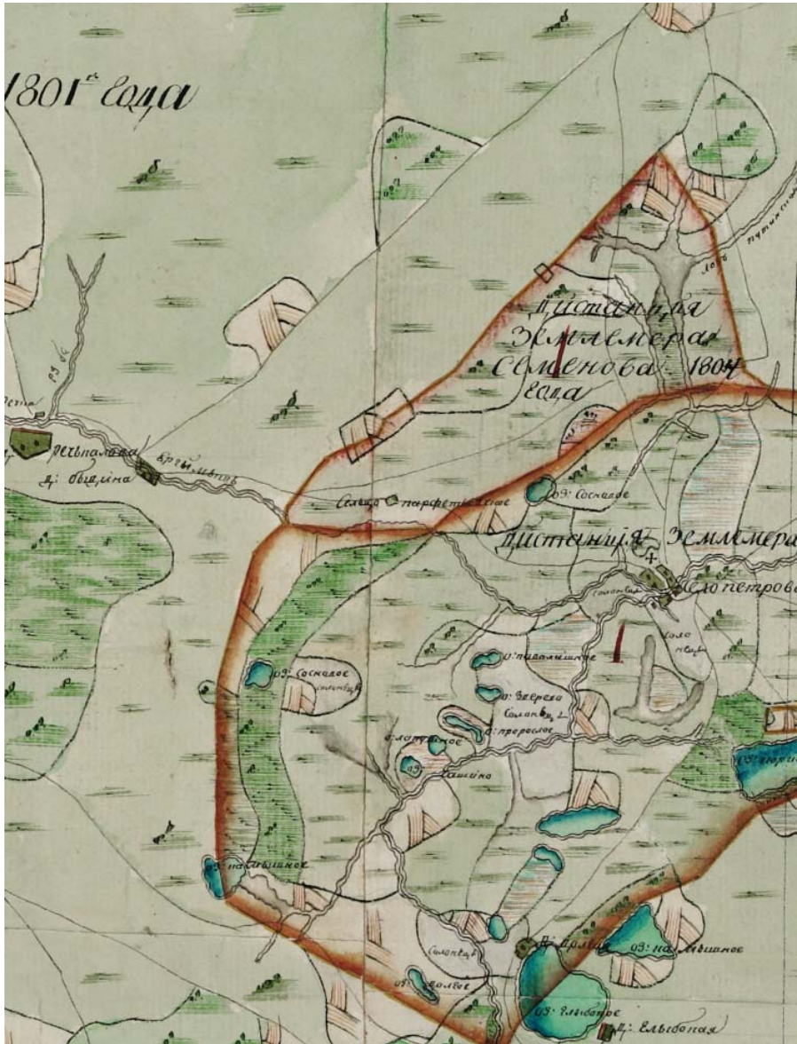
Фото 1 – Сельцо Парфентьевское и село Петровское на карте, 1801 г.