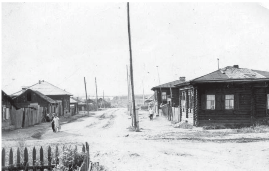
Фото 4 – Улица Комсомольская в г. Кургане, справа – дом Быковых, 1960-е годы