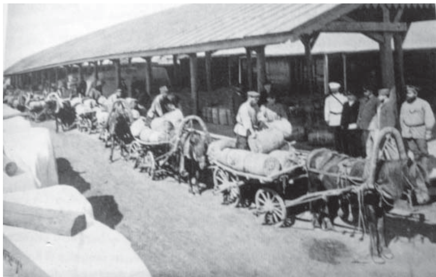
Фото 5 – Погрузка курганского масла на экспорт