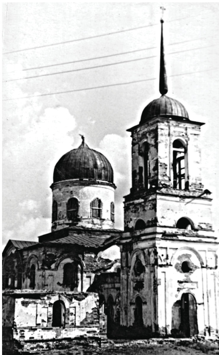
Фото 2 – Благовещенская церковь села Петровского, была построена в первой половине XIX века, после того как деревянная церковь обветшала. Уничтожена в 1960-х годах