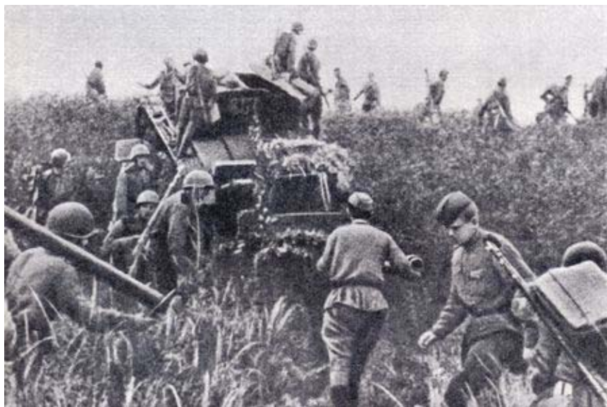
Фото 2 – В Маньчжурском походе.