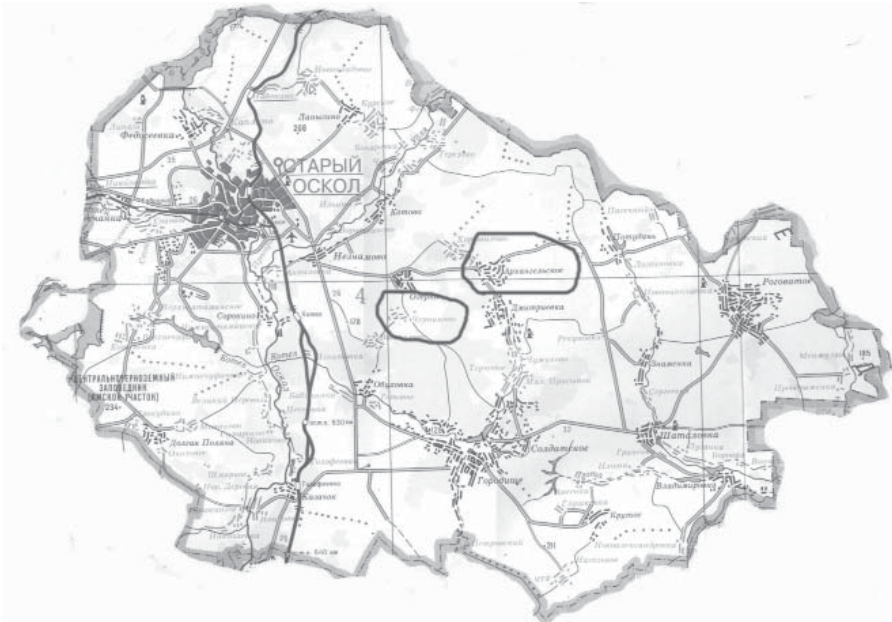
Рисунок 2 – Деревня Черниково (быв. Яблонево) и село Архангельское (быв. Горнее) на современной карте Старооскольского района Белгородской области