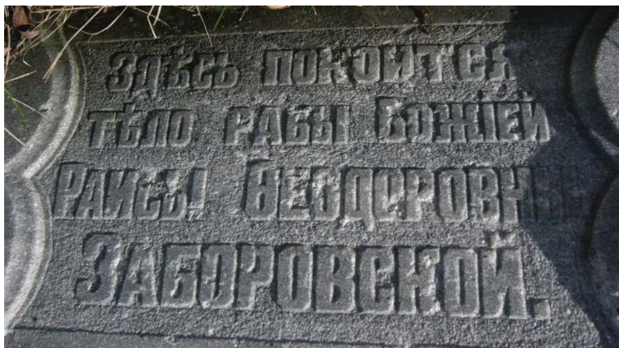
Фото 3 – Фрагмент разрушенного памятника, 2013 год