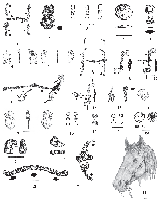
Рис. 1. Курганы 2 могильника Переволочан (курган №11 погребение №1) 1 – двудырчатый псалий, 2 – стержневидный раскованный псалий, 3 – стержневидный раскованный псалий, 4 – стержневидный раскованный псалий, 5 – распределитель для перекрёстных ремней с полусферическим щитком, 6 – бляшка в форме профильной рыбы, 7 – бляшка в форме профильной рыбы, 8 – S-видный двудырчатый псалий, 9 – прямой стержневидный двудырчатый псалий, 10 – прямой стержневидный двудырчатый псалий, 11 – прямой стержневидный двудырчатый псалий, 12 – прямой стержневидный двудырчатый псалий, 13 – прямой стержневидный двудырчатый псалий, 14 – золотая литая плоская подвеска, 15 – распределитель для перекрёстных ремней с зооморфным щитком, 16 – распределитель для перекрёстных ремней с зооморфным щитком, 17 – распределитель для перекрёстных ремней с зооморфным щитком, 18 – распределитель для перекрёстных ремней с зооморфным щитком, 19 – распределитель для перекрёстных ремней с зооморфным щитком, 20 – распределитель для перекрёстных ремней в форме скульптуры лошадиной головы, 21 – бляшка в форме профильной рыбы, 22 – бляшка в форме профильной рыбы, 23 – S-видный двудырчатый псалий.

ся за счёт железной заклёпки, остатки которой фиксируются на месте глаза рыбки. Вероятно, обе бляшки украшали нащёчные ремни оголовья. Подобное назначение может иметь и найденная в заполнении погребения №5, золотая литая плоская подвеска (рис. 1, 14).