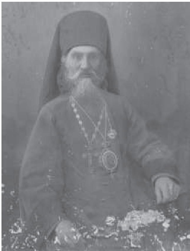
Архиепископ Константин Прокопьев. 1920-е гг.