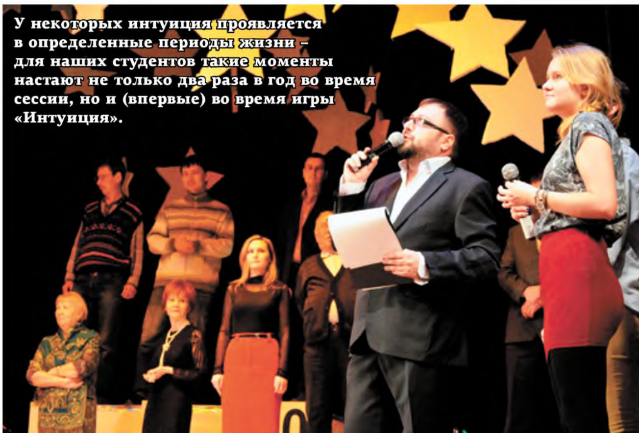
Интуиция не подведет?

У некоторых интуиция проявляется в определенные периоды жизни – для наших студентов такие моменты настанут не только два раза в год во время сессии, но и (впервые) во время игры «Интуиция».