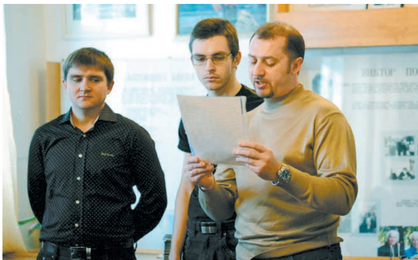
Книги, рукописи, декламация.

В конце сентября мне довелось побывать на четвертом семинаре-совещании молодых писателей «Мы выросли в России» в Оренбургской области, куда