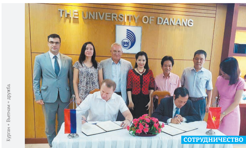
Курган + Вьетнам = дружба.