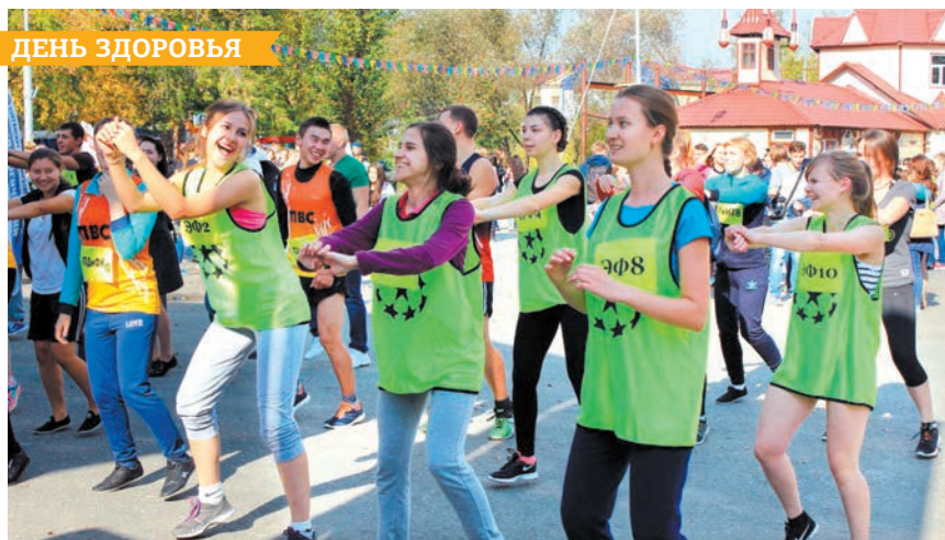
Однажды, субботним утром...

факультет математики и информационных технологий.