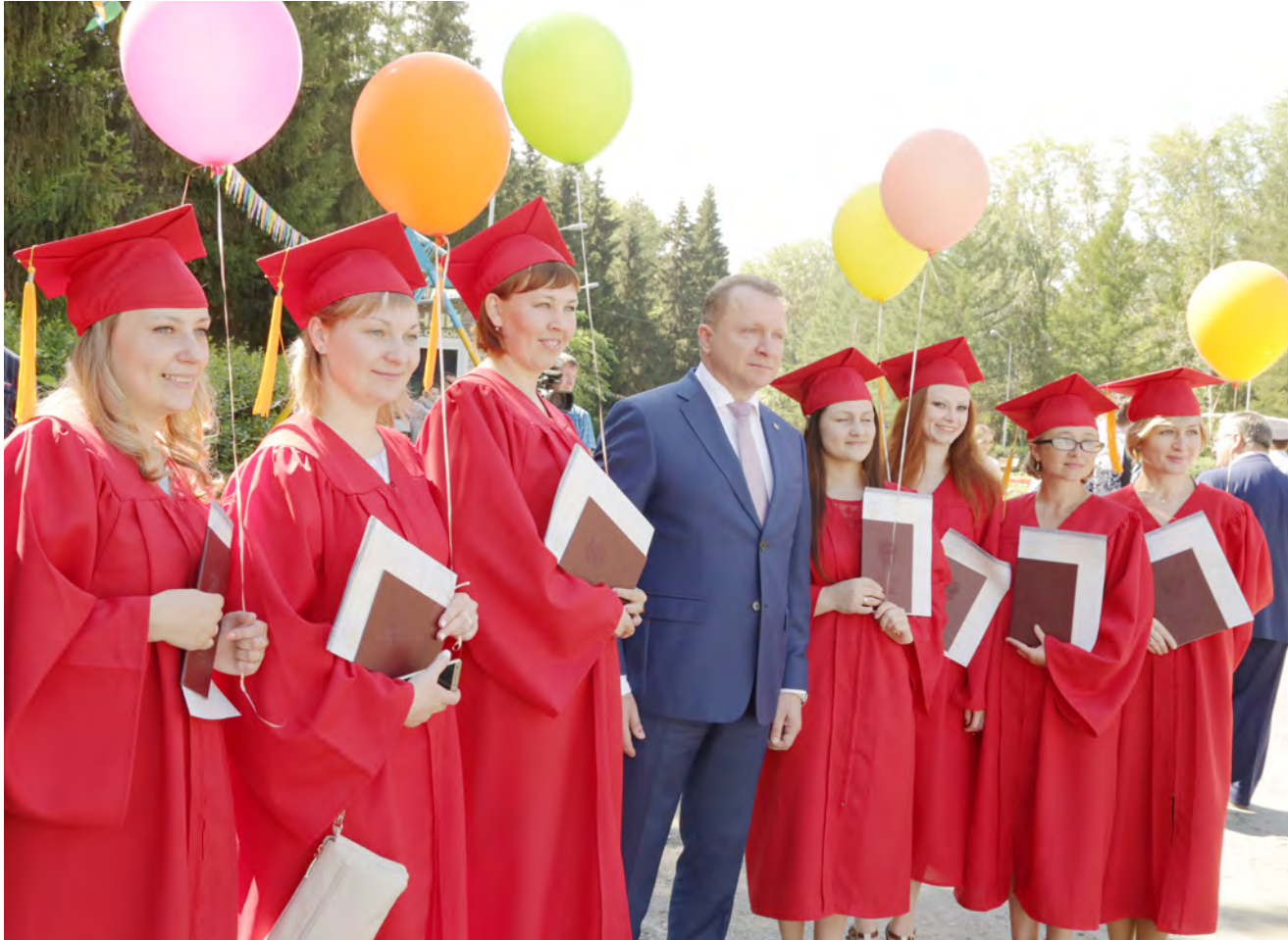
Таковыми успехами нужно гордиться.