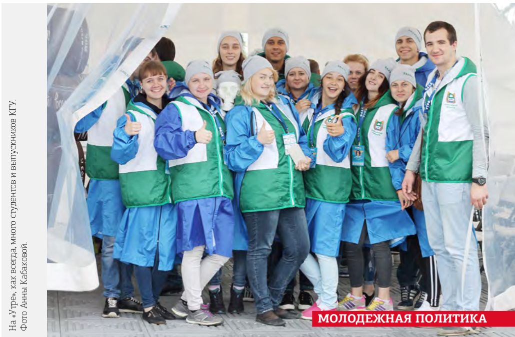
На «Утре», как всегда, много студентов и выпускников КГУ.

Федеральный образовательный форум «УТРО-2016» в этом году обосновался в молодом северном городе Нефтеюганске. На шесть дней инициативная молодежь из Челябинской, Тюменской, Курганской областей, ХМАО, ЯНАО объединилась для развития, обмена опытом и участия в грантовом конкурсе. Поток мыслей об этом событии удалось организовать в словарь форума.