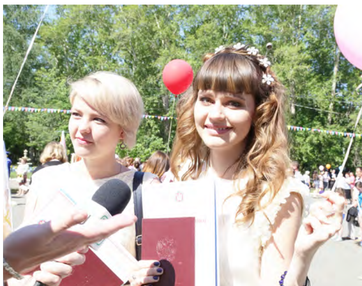
А у нас красные дипломы, а у вас?