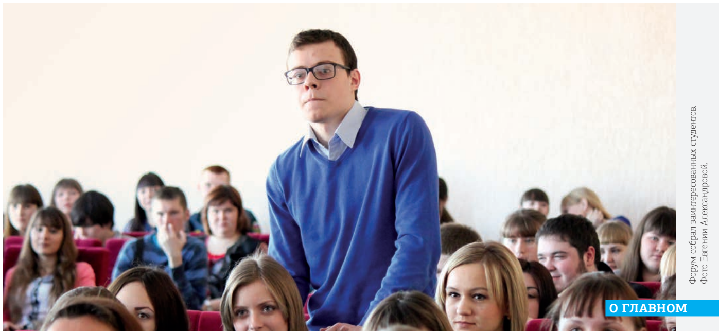
Форум собрал заинтересованных студентов.