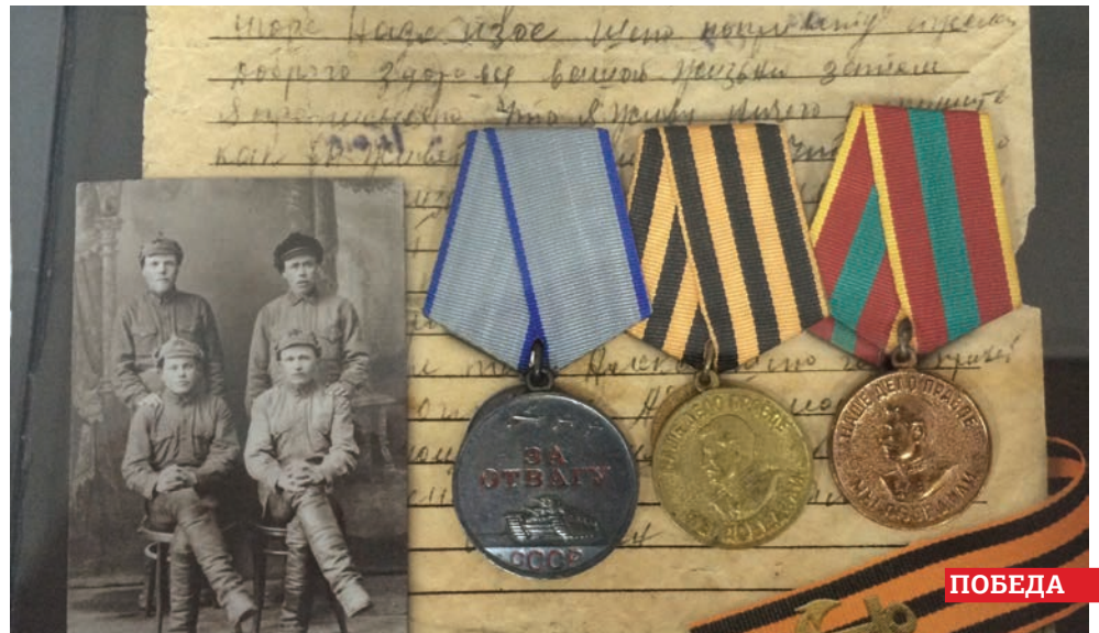
На фотовыставке «Победной весне посвящается» можно увидеть и медали, и оружие времен войны.

На стенах зала – фотографии, в центре – места для зрителей и ветеранов, играет пробирающая до мурашек музыка, в углу стоят макеты пулеметов, а рядом люди в солдатской форме времен Великой Отечественной.