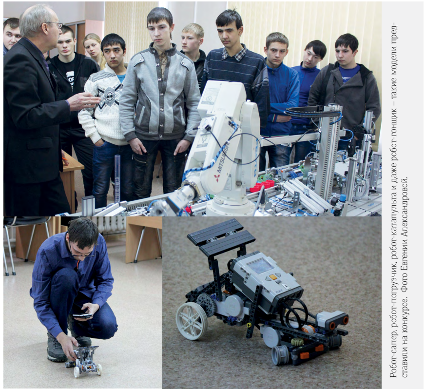
Робот-сапер, робот-погрузчик, робот-катапульта и даже робот-гонщик – такие модели представили на конкурсе.