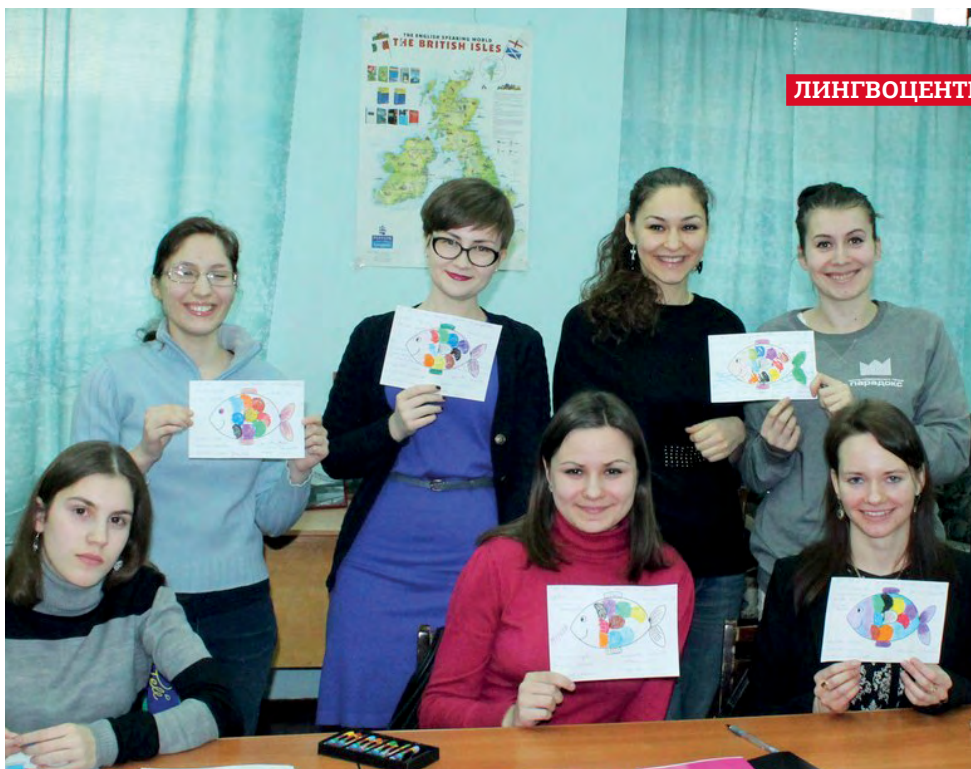
Раскрашивание изображений с произношением цветов на испанском – одно из наиболее эффективных упражнений для начинающих испанцев.

Когда меня пригласили посетить двухчасовой урок испанского в Лингвоцентре КГУ, я согласилась. «Посижу тихонько в уголке, послушаю звонкую испанскую речь, проникнусь колоритом», – думалось мне.