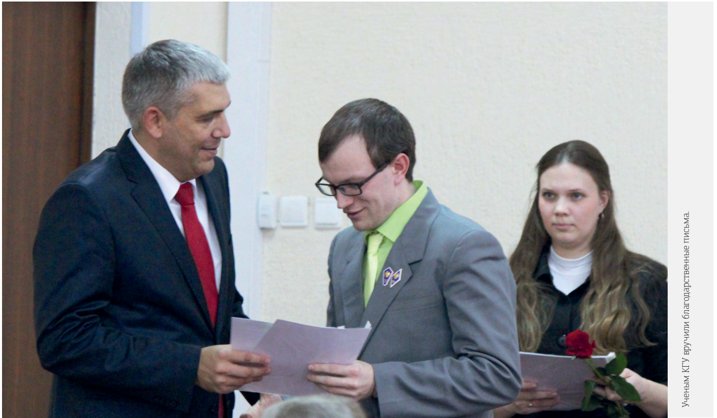
Ученым КГУ вручили благодарственные письма.