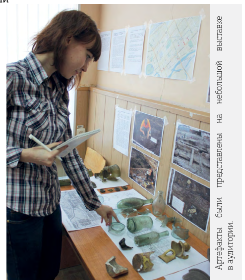
Артефакты были представлены на небольшой выставке в аудитории.