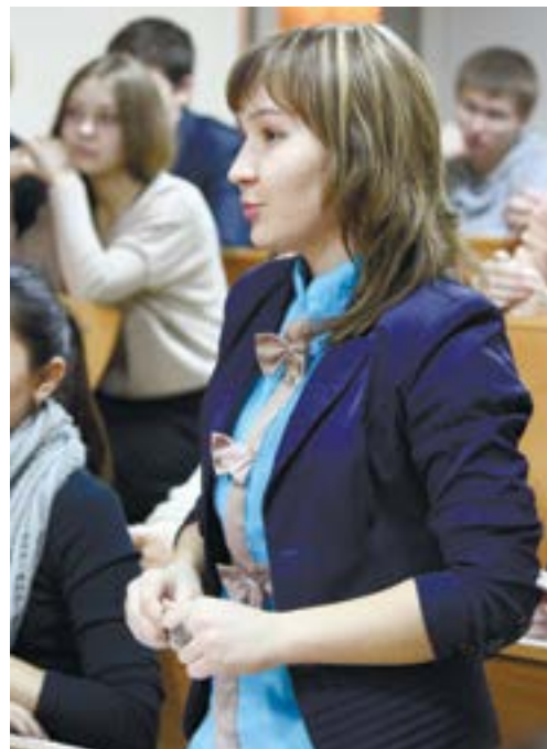
Вопросов ректору задали много.

– Копи-центры и на истфаке, и на юрфаке были убыточны. Они принадлежали нашей типографии, и мы можем снова их открыть, но нанимать продавца, расходовать материалы, имея при