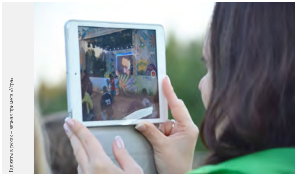
Гаджеты в руках – верная примета «Утра».

Молодежный форум «УТРО» прошел уже четвертый раз. Ранее площадками палаточного городка становились база отдыха «Солнечная долина» (Челябинская обл.) и поляна у с. Знаменское (Свердловская обл.).