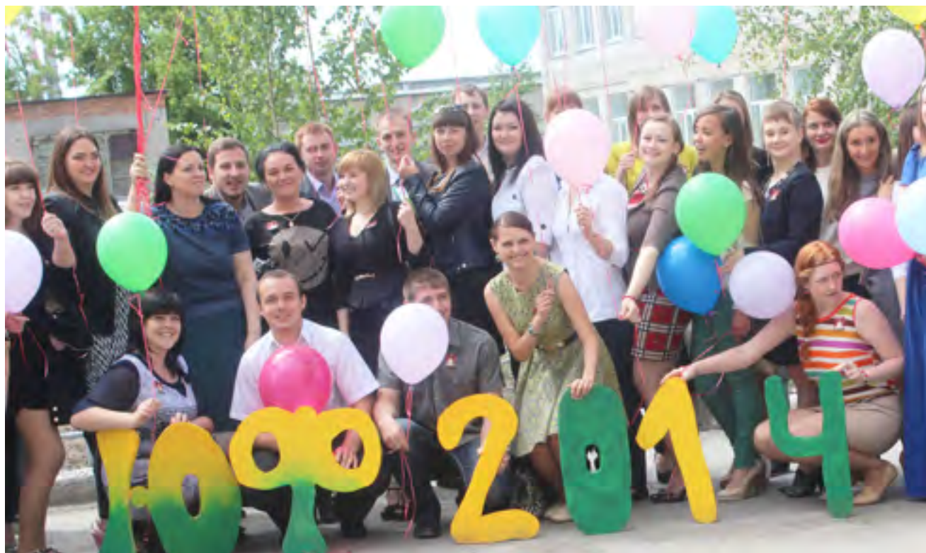
Мы еще вместе!

По традиции на многих факультетах проходят последние звонки, но не такие как в школе, а особенные, потому что это действительно последний звонок!