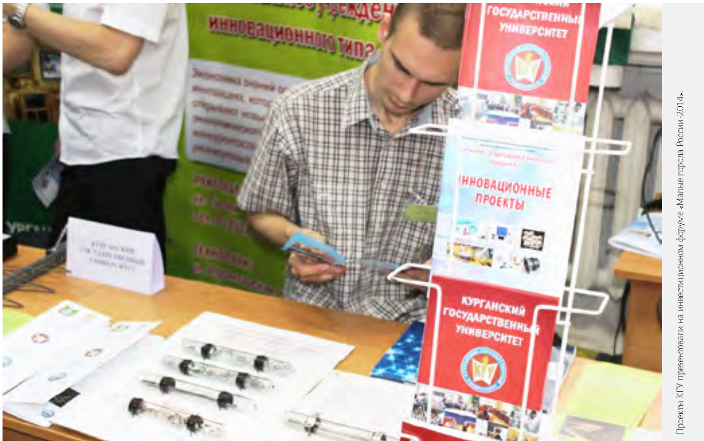
Проекты КГУ презентовали на инвестиционном форуме «Малые города России-2014».