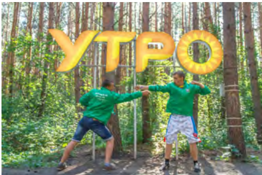
Вместо утренней гимнастики – разминка.

Ксения Алексеева.