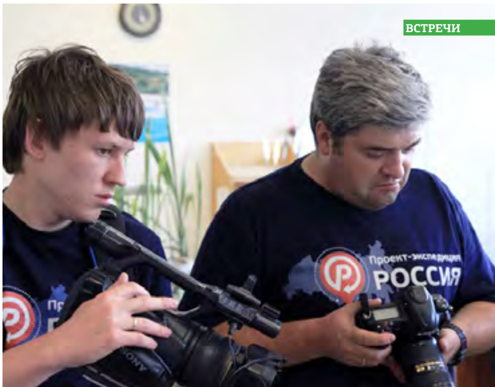
Идейный вдохновитель проект-экспедиции «Россия» Сергей Доля (справа).

Студенты-географы КГУ встретились с известным путешественником и блогером Сергеем Долей. Он посетил Курган в рамках проекта-экспедиции «Россия».