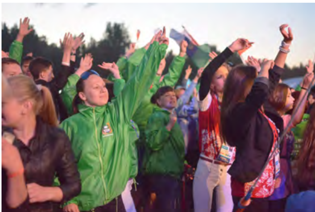
Утро на «Утре» всегда. Даже ночью.

Может ли весь день быть утро? По законам природы, конечно же, нет, а по правилам форума «УТРО» может. Десять дней форумчане жили в ярких лучах рассвета на территории пансионата «Карагайский бор».