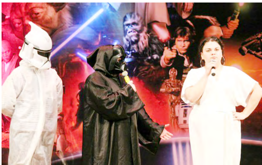
«Звездные войны» транспортных систем.