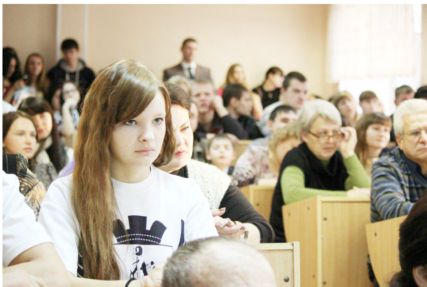
Здоровый образ жизни интересует всех от мала до велика – в аудитории не было свободных мест.

Региональная научно-практическая конференция «Проблемы и перспективы развития физической культуры и спорта в Зауралье» прошла в КГУ 22 ноября.