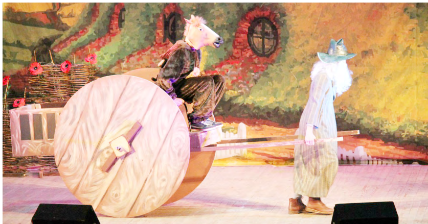
Фэнтэзи педагогического факультета «Властелин колец».