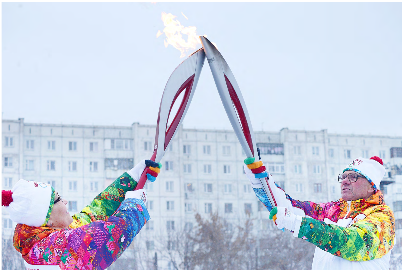
Общая протяженность маршрута, по которому пронесли олимпийский огонь, по Кургану составила порядка 14 км.