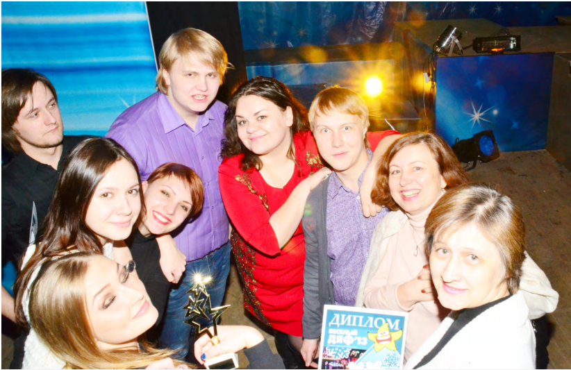
Победителями в номинации «Лучшая концертная программа» жюри назвало ребят с филологического факультета

З а кулисами столпились выступающие — уже победители четырех концертных дней. Тут же на столе стоит коробка со статуэтками и два десятка пакетов с подарками. Встать некуда. Чтобы отыскать в приклеенном на кулисе списке номеров себя, нужно протискиваться сквозь стоящих. Еще до начала концерта поступил приказ «не тормозить». Тут же суетятся парни - работники сцены. Мало кто из сидящих в зале их знает, они незаменимые участники каждого университетского