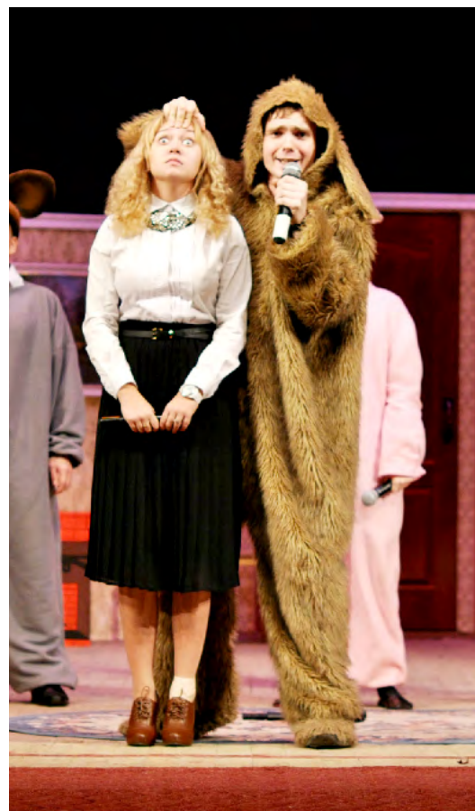
Экономисты представили жюри трагикомедию «10 негрятя».

«ДяФ» в стиле вестерна от факультета психологии, валеологии и спорта.