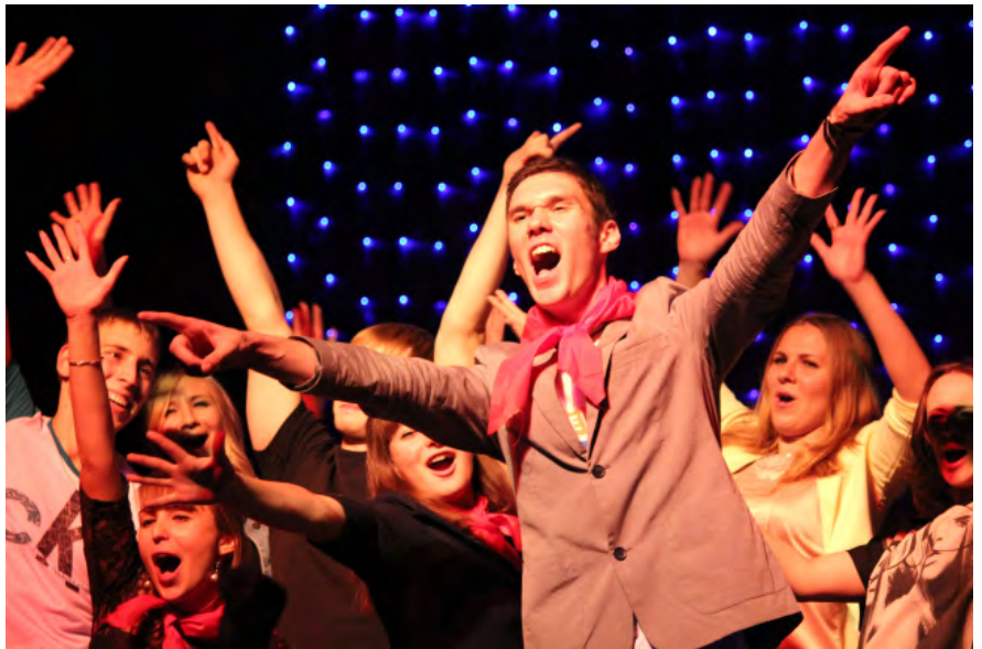
Если у студентов галстуки были стилизованы под пионерские, то у многих преподавателей сохранились оригинальные. Это на пионерской вечеринке сегодня определенный шик.