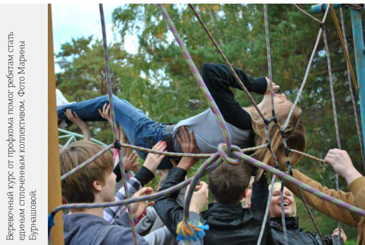
Веревочный курс от профкома помог ребятам стать единым сплоченным коллективом.

А вот студенты педагогического факультета нарушили традицию посвящения, которое обычно было приурочено к профессиональному празднику – Дню учителя. В этом году оно состоялось раньше и прошло на базе отдыха «Бараба».