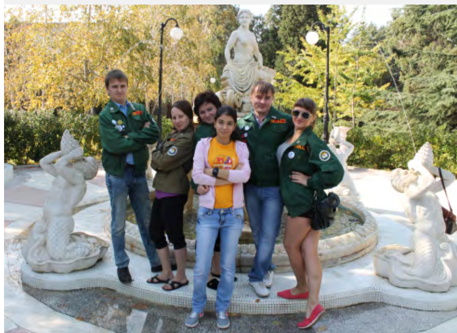
Бойцы-активисты ССО на 54-м Всероссийском слете студенческих отрядов в г. Сочи.