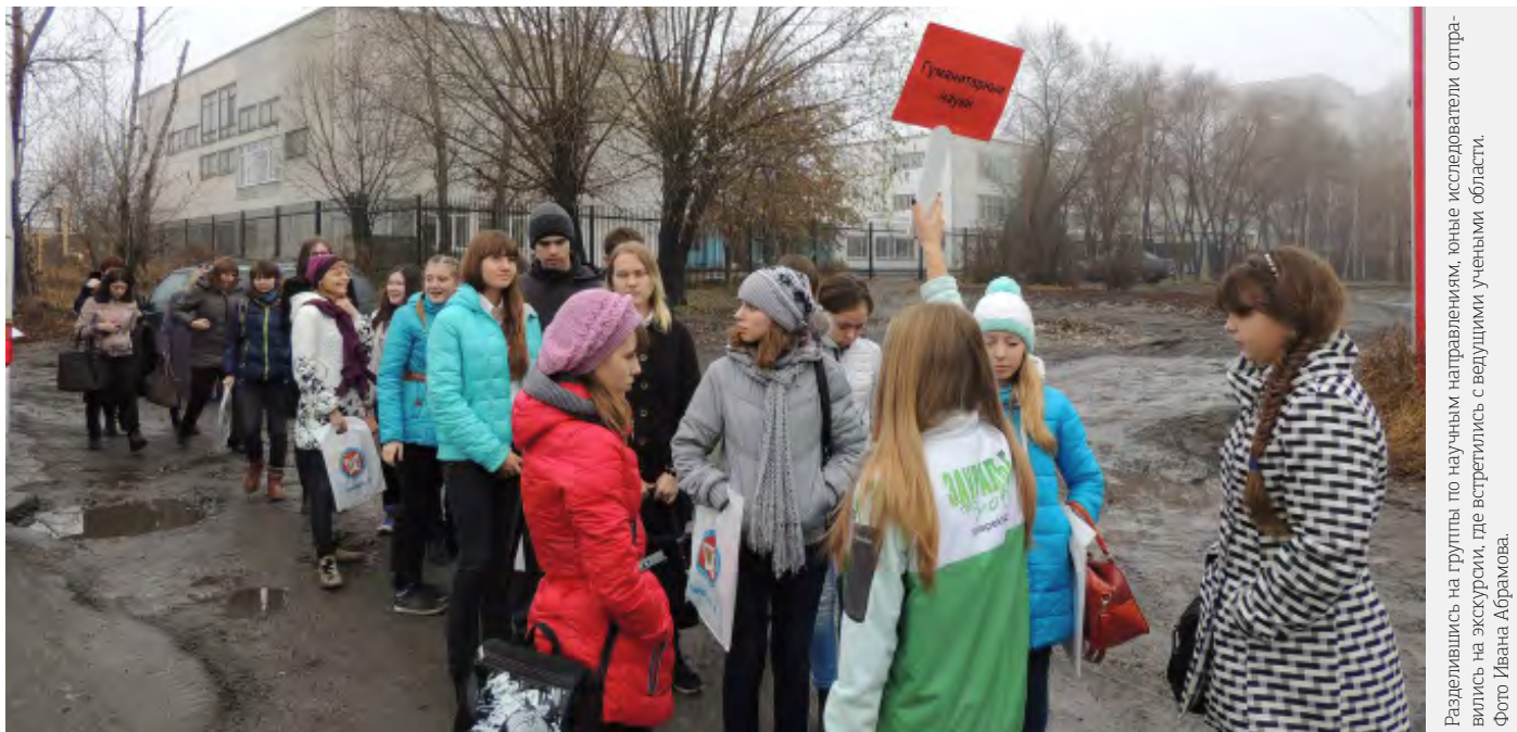
Разделившись на группы по научным направлениям, юные исследователи отравились на экскурсию, где встретились с ведущими учеными области.