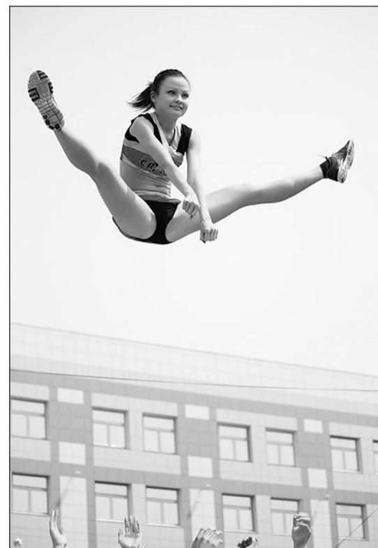
Выступление команды «Крафт»