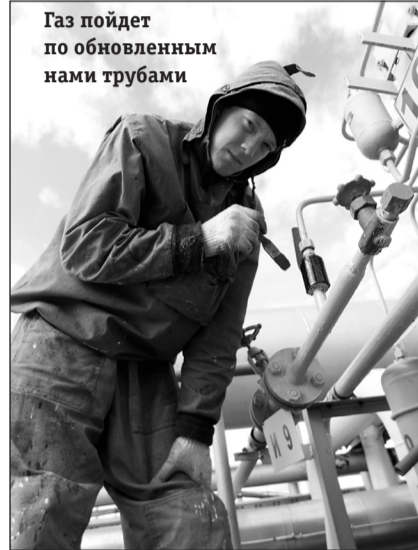
Газ пойдет по обновленным нами трубам