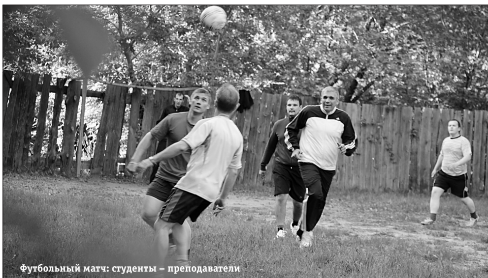
Футбольный матч: студенты — преподаватели