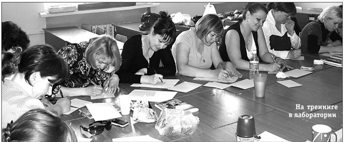
На тренинге в лаборатории

— Причин такой зависимости несколько. Прежде всего, ребенок привыкает к «общению» с компьютером, когда не складываются отношения с родителями в семье, когда ребенок безнадзорен, когда родители, будучи деловыми людьми, откупаются от ребенка деньгами. В результате ребенок не может общаться с живыми людьми. Мы изучали статус таких детей в классах: с ними никто не общается, их никто не выбирает в друзья, они часто бывают изгоями. У них полностью убиты свойства человека как активного субъекта, деятеля. Они не способны принимать решения, легко идут на поводу, к реальной жизни не приспособлены.