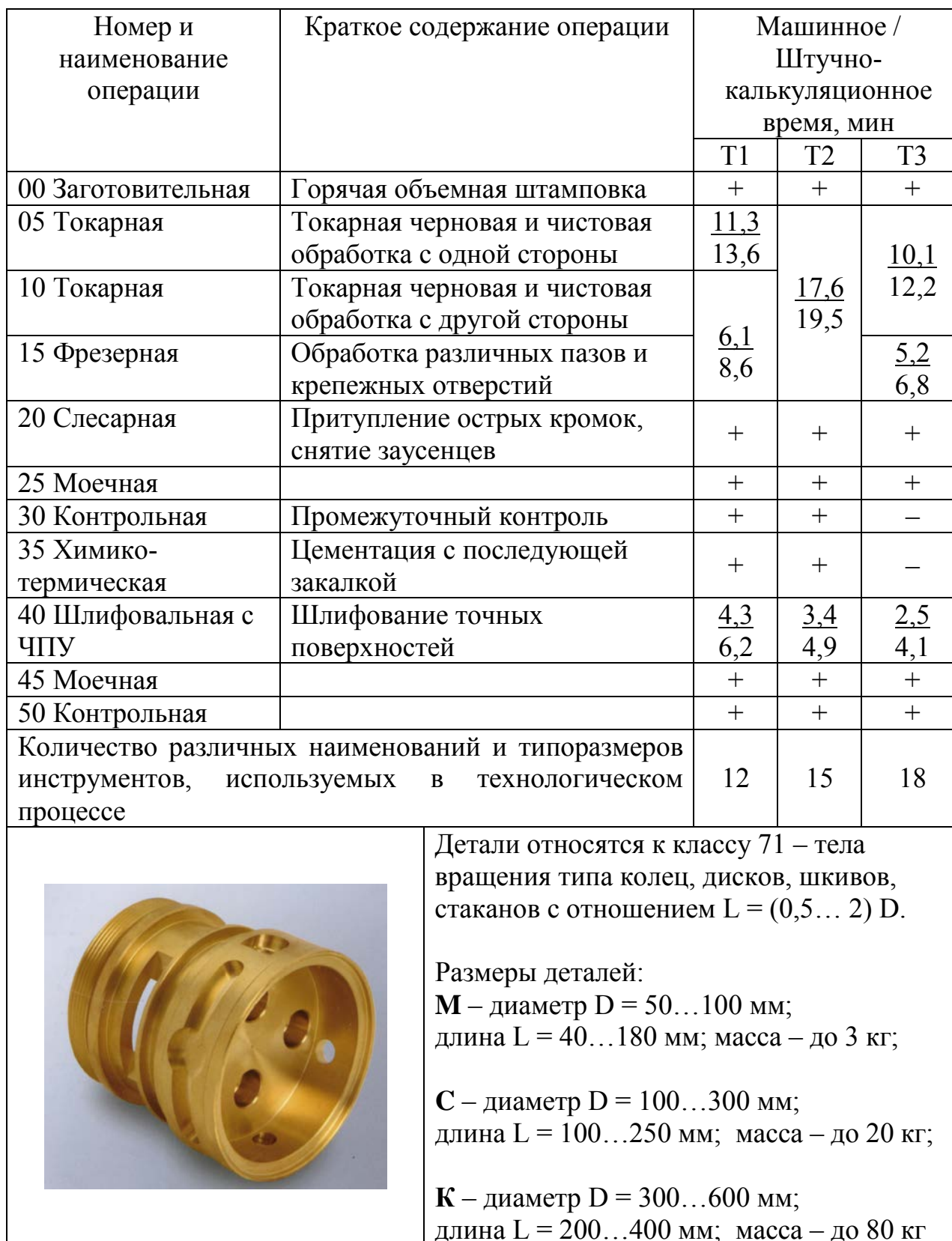
Таблица А8 – Маршрутная технология изготовления втулок