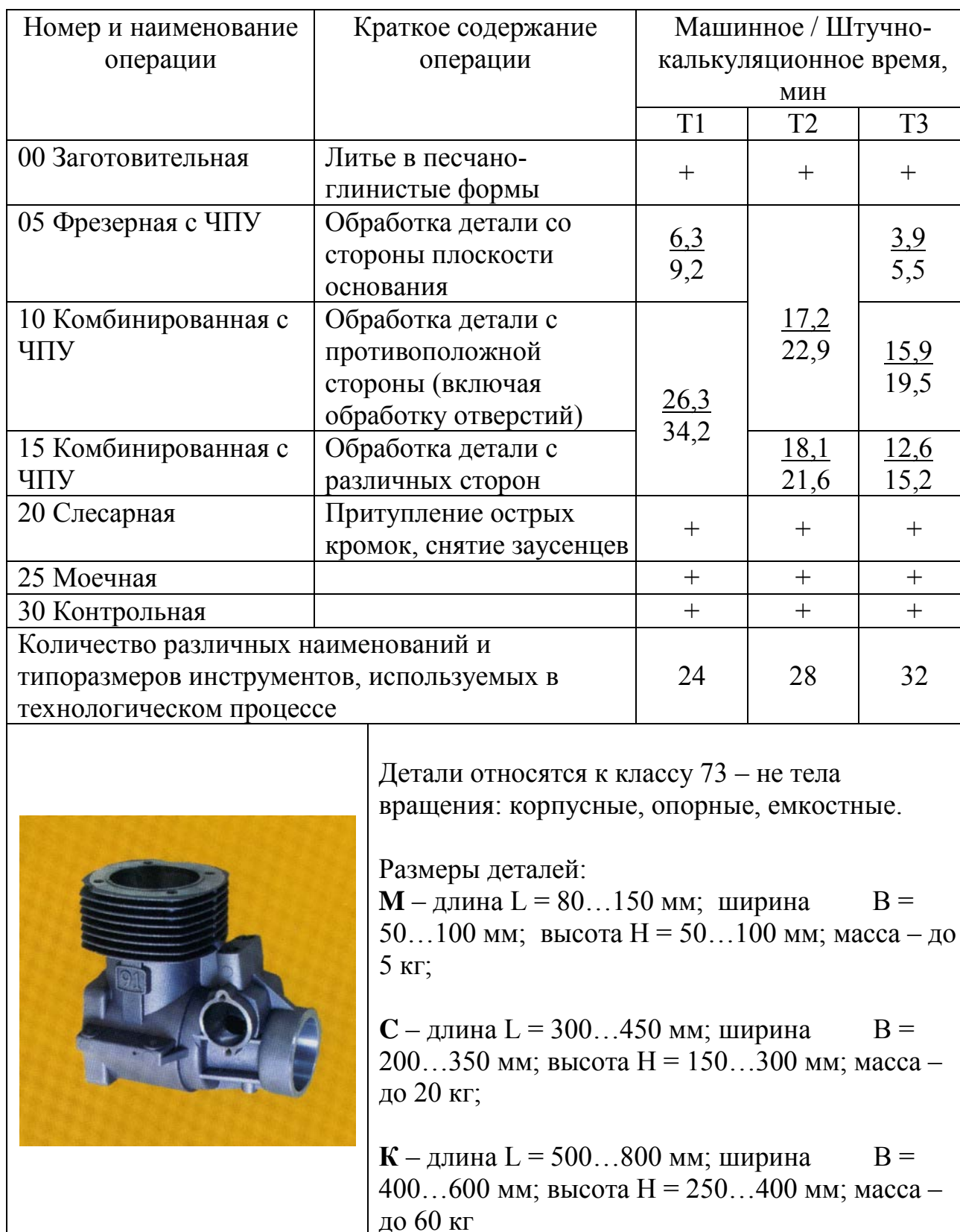
Таблица А1 – Маршрутная технология изготовления корпусов двигателя