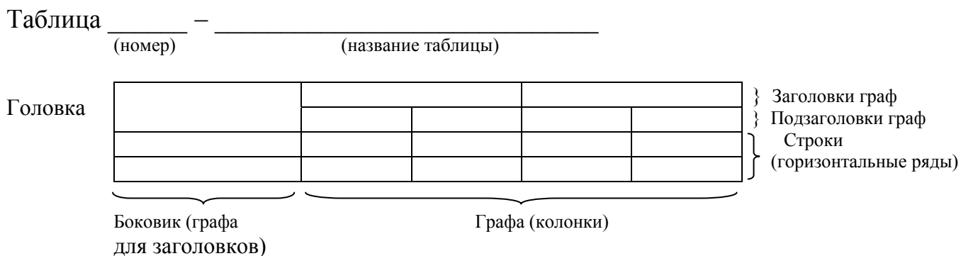
Рисунок 1 – Пример оформления таблиц

Таблица должна иметь название, которое следует выполнять строчными буквами (кроме первой прописной) и помещать над таблицей. Заголовки граф и строк таблицы начинают с прописных букв. Разделять заголовки и подзаголовки боковика и граф диагональными линиями не допускается. Заголовки граф могут быть записаны параллельно или перпендикулярно (при необходимости) строкам таблицы. Допускается применять размер шрифта в таблице меньший, чем в тексте (кегель не менее 10). Таблицы, за исключением таблиц приложений, следует нумеровать арабскими цифрами сквозной нумерацией. Допускается нумеровать таблицы в пределах раздела. В этом случае номер таблицы состоит из номера раздела и порядкового номера таблицы, разделенных точкой.