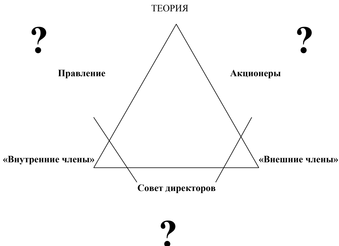
Рис. 2. Модель управления российскими акционерными обществами