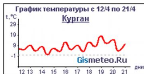
График температурных изменений