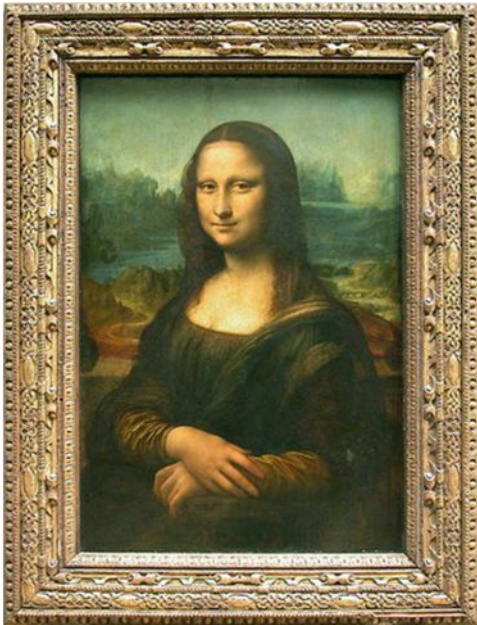
Портрет Моны Лизы

http://www.globmuseum.info/katalog-muzeev/luvr/tri-bogini-iz-luvra/mona-liza/