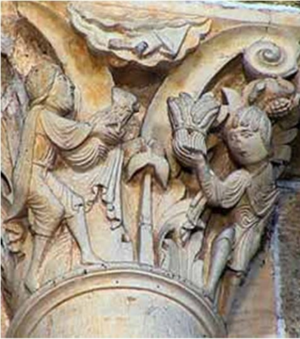
Церковь Сен-Мадоев в Везле. 1120 – 50 Жертвоприношение Авеля и Каина