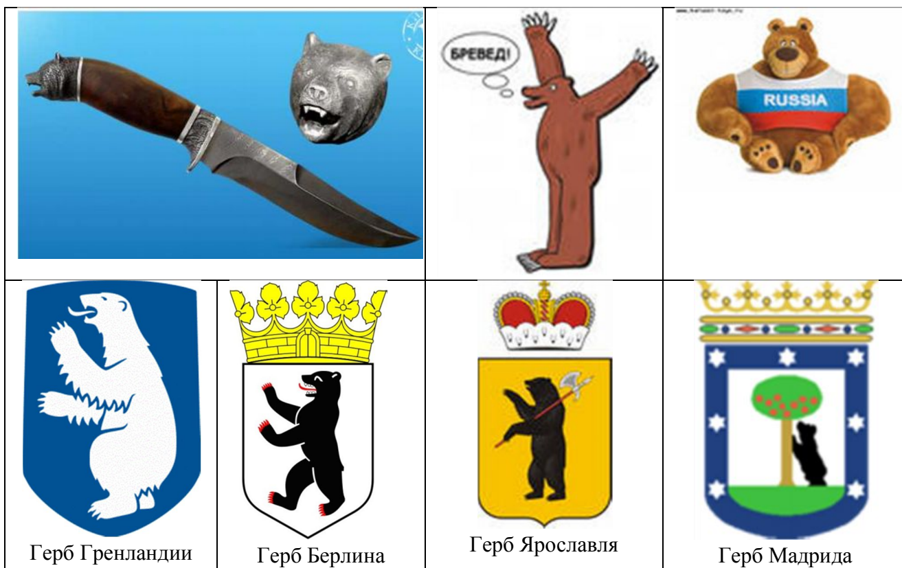
Таблица температурных изменений: