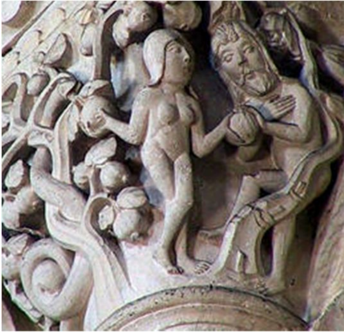
Капитель колонны из церкви Сен-Мадлен в г. Везде (Франция). 1120-50 гг.

1 «И сказал змей жене: подлинно ли сказал Бог: не ешьте ни от какого дерева в раю?»